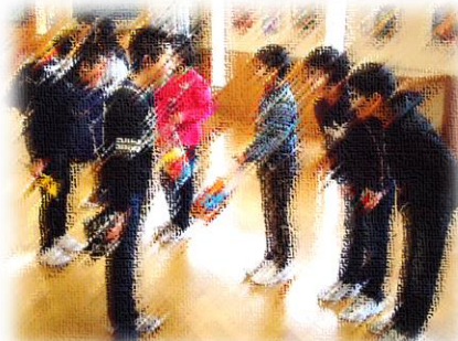
朝の廊下でのあいさつ運動

2018年、平成30年、新しい年を迎えました。新年を迎えると前の年、前の日と空間軸や時間軸は変わりませんが、何か清新な気持ちになります。「今年は頑張るぞ!」といった新たな決意をもちます。