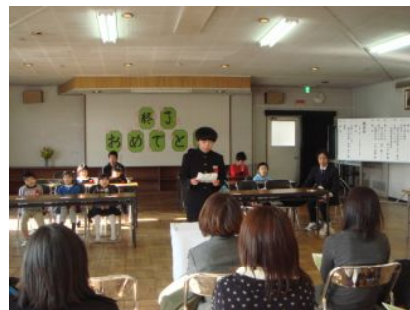
終了者代表のあいさつ

終了者と保護者の皆様、本当におめでとうございました。これからもますます御活躍ください。