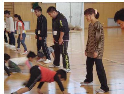
(前年度の体操教室の様子)