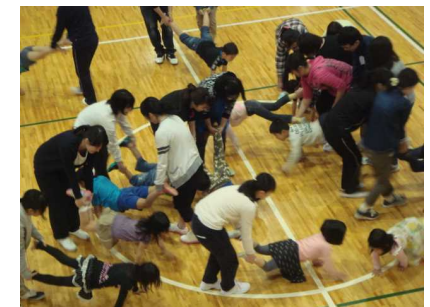
(前年度の体操教室の様子)